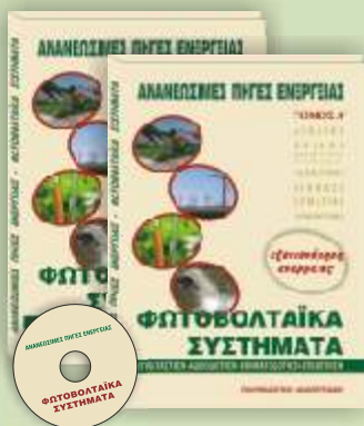
ΑΝΑΝΕΩΣΙΜΕΣ ΠΗΓΕΣ ΕΝΕΡΓΕΙΑΣ (ΦΩΤΟΒΟΛΤΑΪΚΑ κ.λπ.) 2 ΤΟΜΟΙ + 1 CD ROM Τιμή 80 €