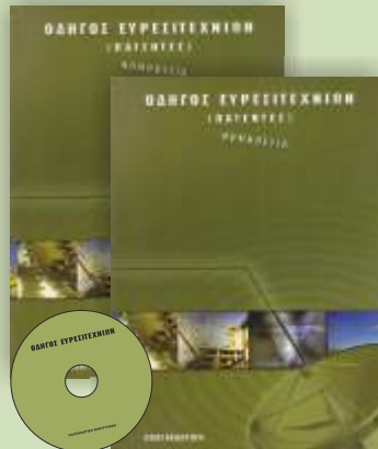
ΟΔΗΓΟΣ ΕΥΡΕΣΙΤΕΧΝΙΩΝ 2 ΤΟΜΟΙ + 1 CD ROM Τιμή 90 €