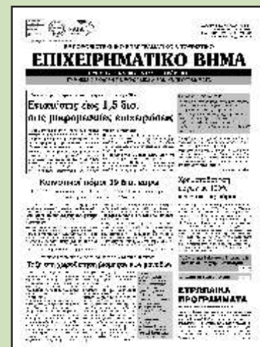
ΤΡΙΜΗΝΙΑΙΑ ΕΦΗΜΕΡΙΔΑ "ΕΠΙΧΕΙΡΗΜΑΤΙΚΟ ΒΗΜΑ" ΕΤΗΣΙΑ ΣΥΝΔΡΟΜΗ 90 €