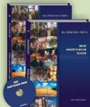
ΝΕΟΣ ΑΝΑΠΤΥΞΙΑΚΟΣ ΝΟΜΟΣ 2 ΤΟΜΟΙ + 1 CD ROM Τιμή 67 €