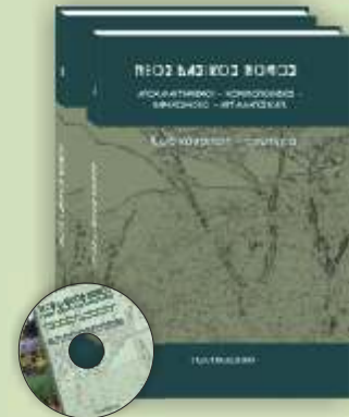
ΝΕΟΣ ΔΑΣΙΚΟΣ ΝΟΜΟΣ 2 ΤΟΜΟΙ + 1 CD ROM Τιμή 90 €