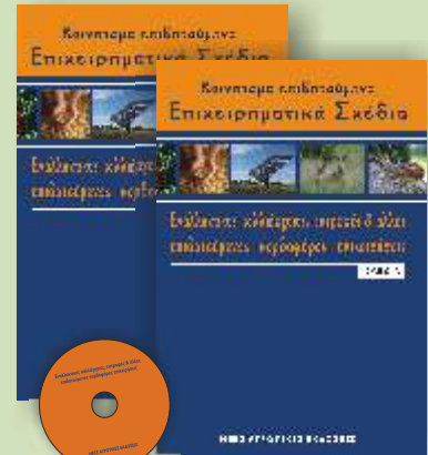
ΕΝΑΛΛΑΚΤΙΚΕΣ ΚΑΛΙΕΡΓΕΙΕΣ, ΕΚΤΡΟΦΕΣ & ΑΛΛΕΣ ΚΕΡΔΟΦΟΡΕΣ ΕΠΙΧΕΙΡΗΣΕΙΣ 2 ΤΟΜΟΙ + 1 CD ROM Τιμή 85 €